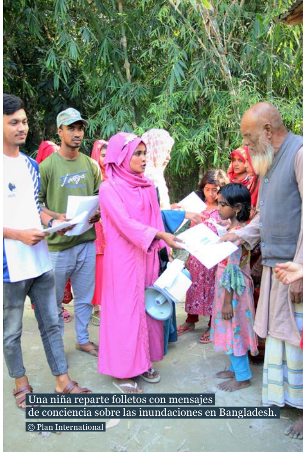
Una niña reparte folletos con mensajes de conciencia sobre las inundaciones en Bangladesh.

Fatima, mujer, 45 años, Bangladesh, madre de adolescente patrocinada