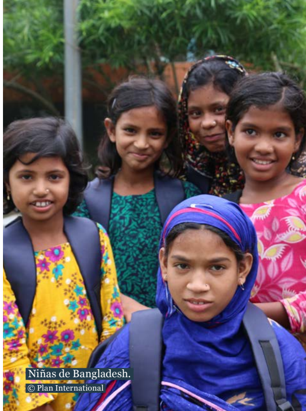
Niñas de Bangladesh.

Plan International se esfuerza por mejorar continuamente los programas y la calidad de los mismos, lo cual ha dado lugar a una serie de investigaciones orientadas a la acción ( Cambiando Vidas ), sobre el impacto del patrocinio en las niñas y los niños patrocinados y sus comunidades.