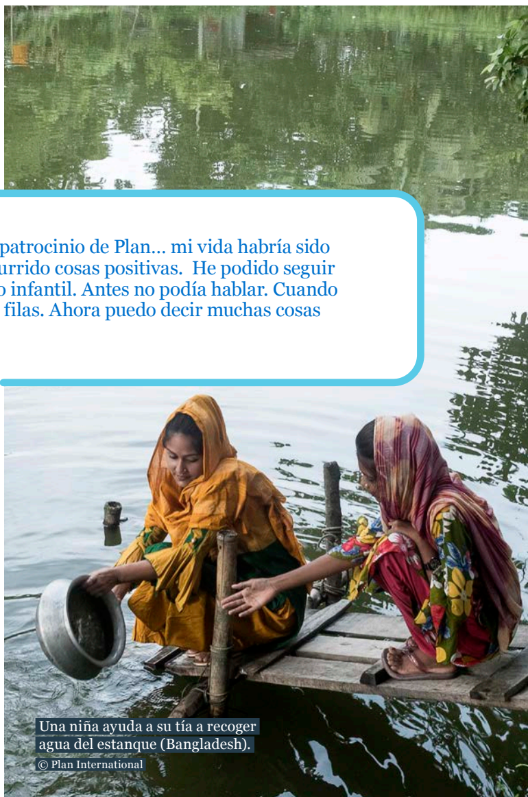
Una niña ayuda a su tía a recoger agua del estanque (Bangladesh).

Segundo, los hallazgos indican que importantes resultados de desarrollo, como la asistencia regular a la escuela y el acceso a instalaciones de agua y saneamiento, mejoran a medida que Plan Internacional lleva más tiempo trabajando en una comunidad. Esto respalda la adopción de un enfoque de alianzas a largo plazo para el desarrollo, ya que es probable que las mejoras en los resultados tarden en producirse. La constatación de que los niveles de cohesión y confianza de la comunidad eran más altos en las comunidades de Plan Internacional que en los lugares de comparación de Bangladesh también respalda este enfoque. El hecho de que Plan Internacional trabaje con organizaciones