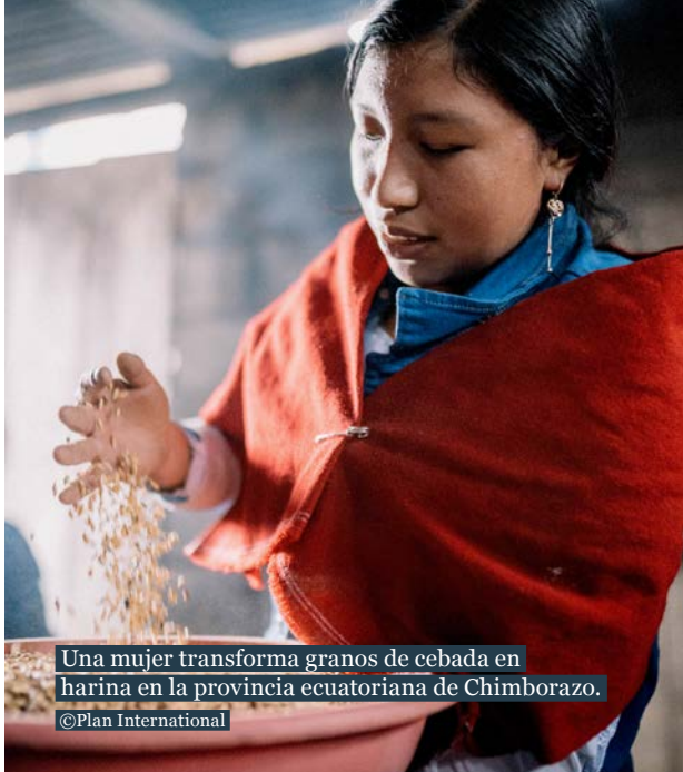
Una mujer transforma granos de cebada en harina en la provincia ecuatoriana de Chimborazo.